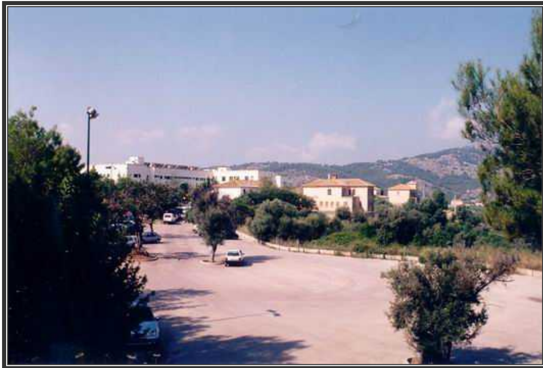
Vista panorámica de los aparcamientos situados en la parte posterior del recinto hospitalario.