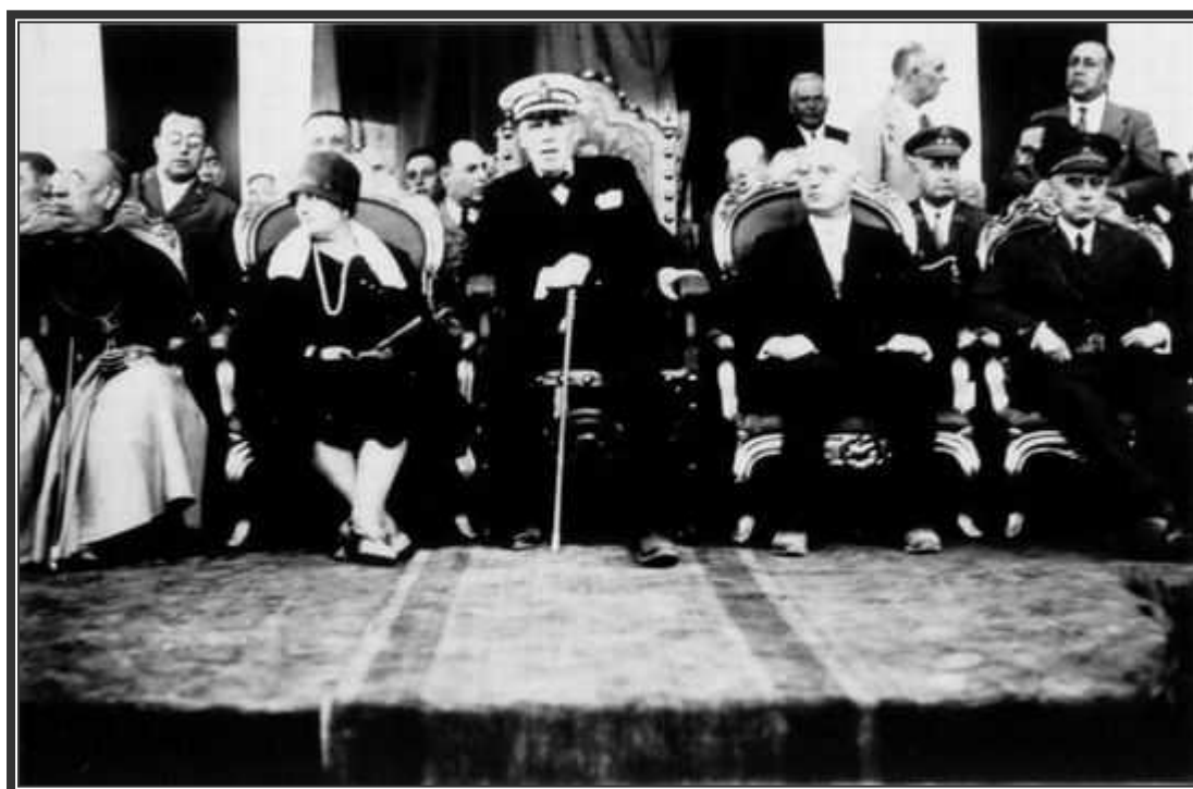
Inauguración del Hospital Juan March, presiden don Juan March y doña Leonor Servera.