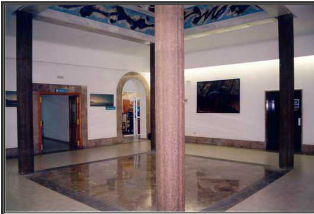
Detalle del distribuidor del Hospital Joan March.