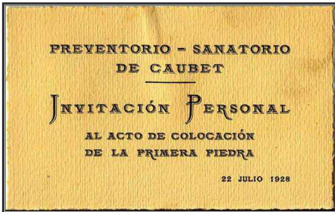
Tarjeta de invitación al acto de colocación de la primera piedra Hospital de Caubet. (Colección Can Verga)