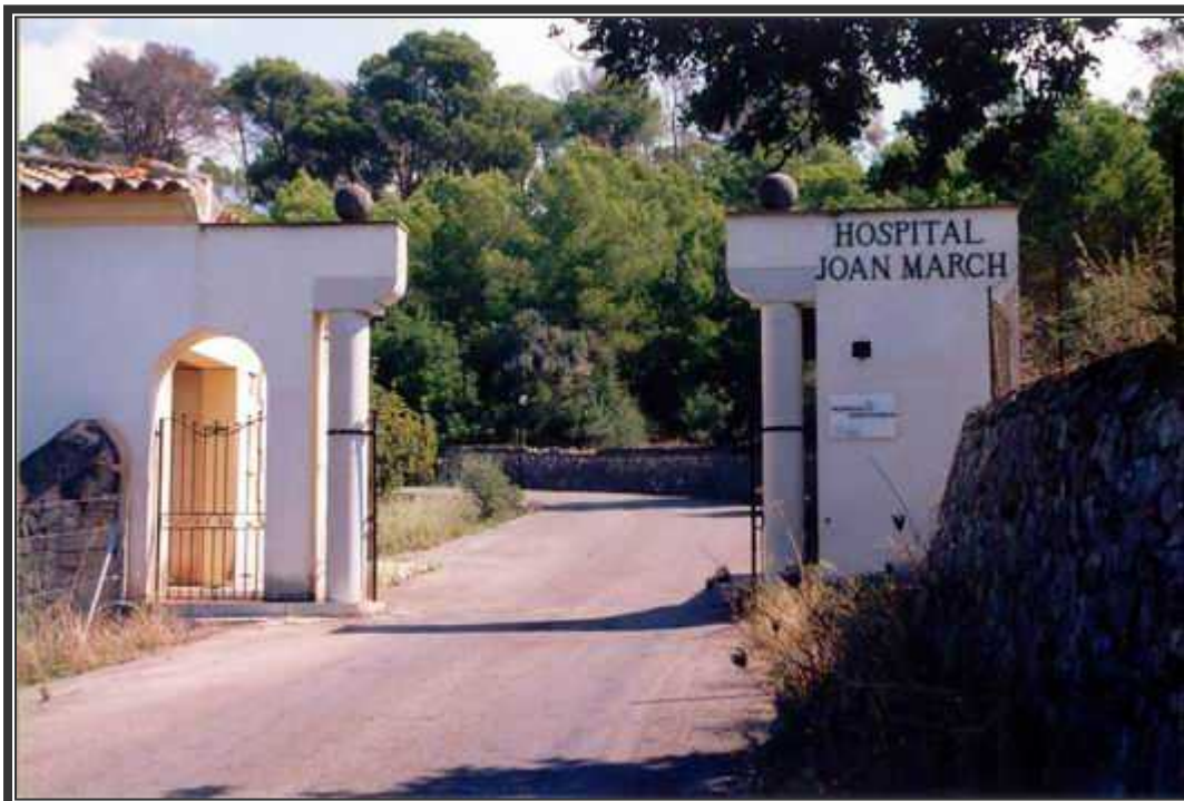
Entrada al recinto hospitalario de la finca de Caubet.