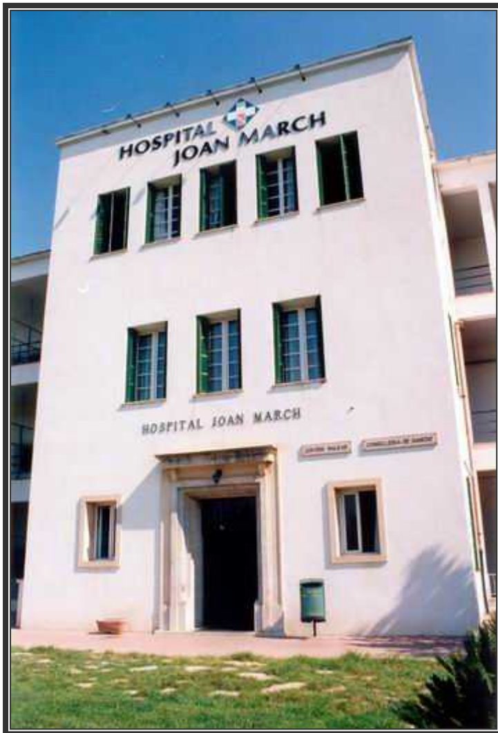
Entrada al edificio principal del Hospital Joan March.