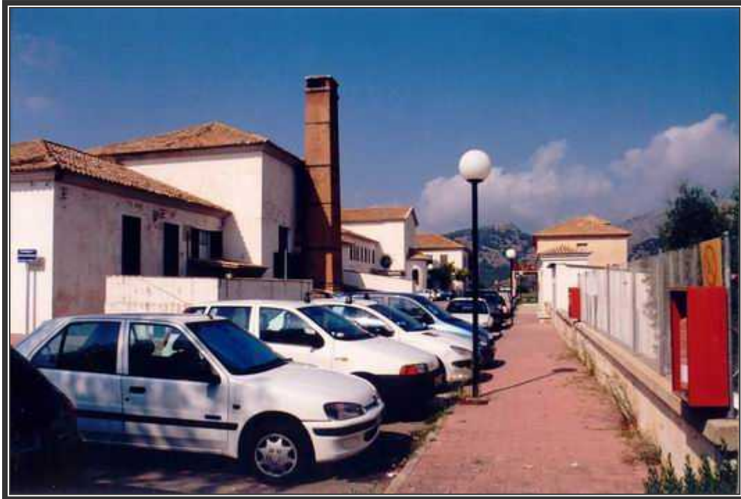
Calle de acceso a los edificios de servicios del complejo hospitalario.