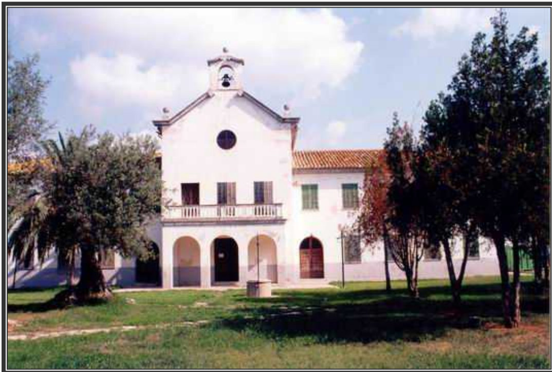
Esta es la capilla que se construyó en el recinto hospitalario de Caubet.