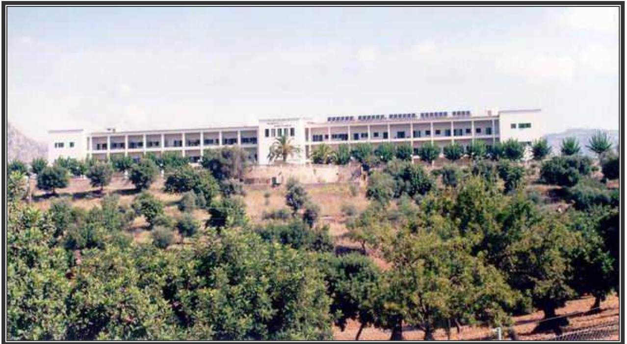
Vista panorámica del Hospital Joan March, con su aspecto actual.