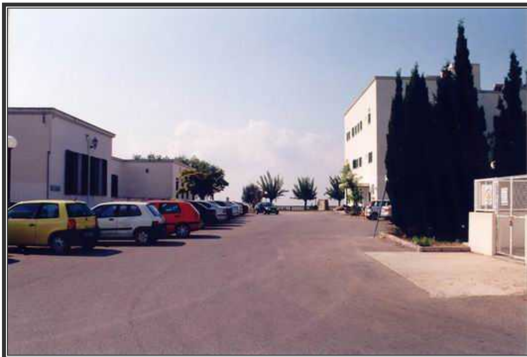
Calle principal del complejo hospitalario, a la izquierda los edificios administrativos.