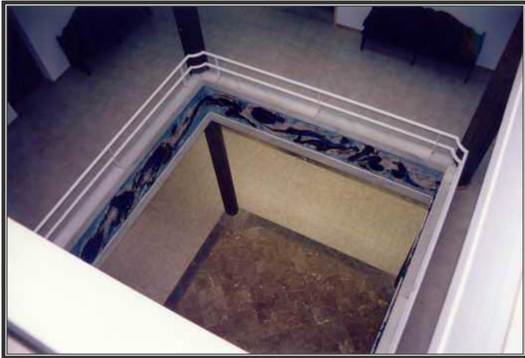
Vista del distribuidor del Hospital Juan March desde el segundo piso.