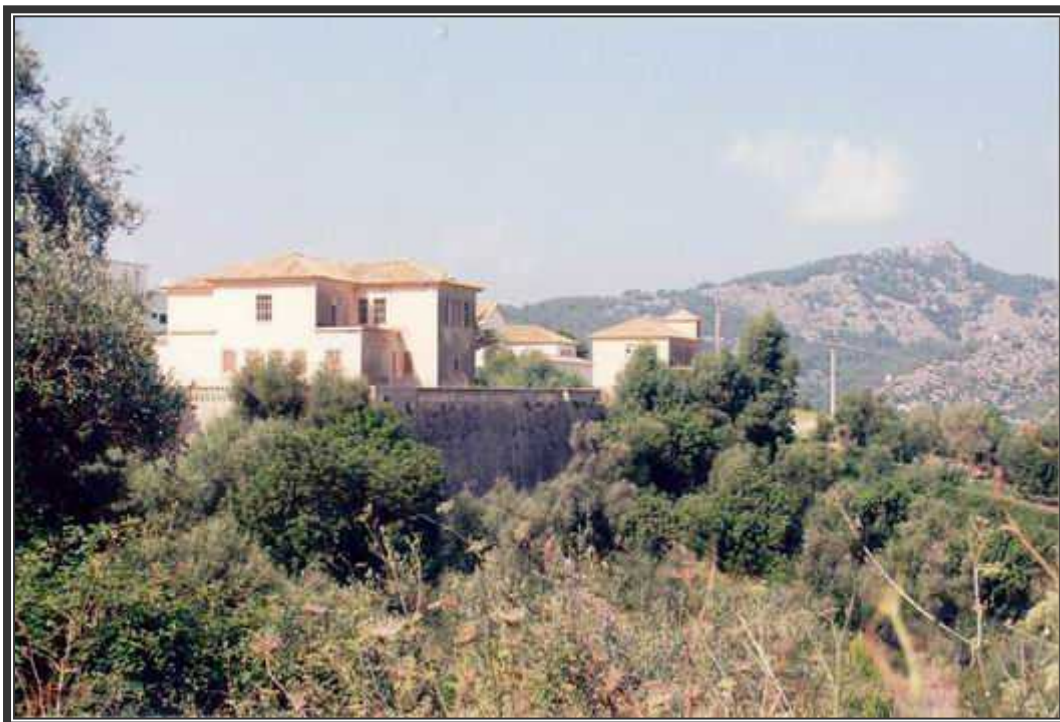
Vista de algunos de los edificios que no se utilizan en la actualidad.