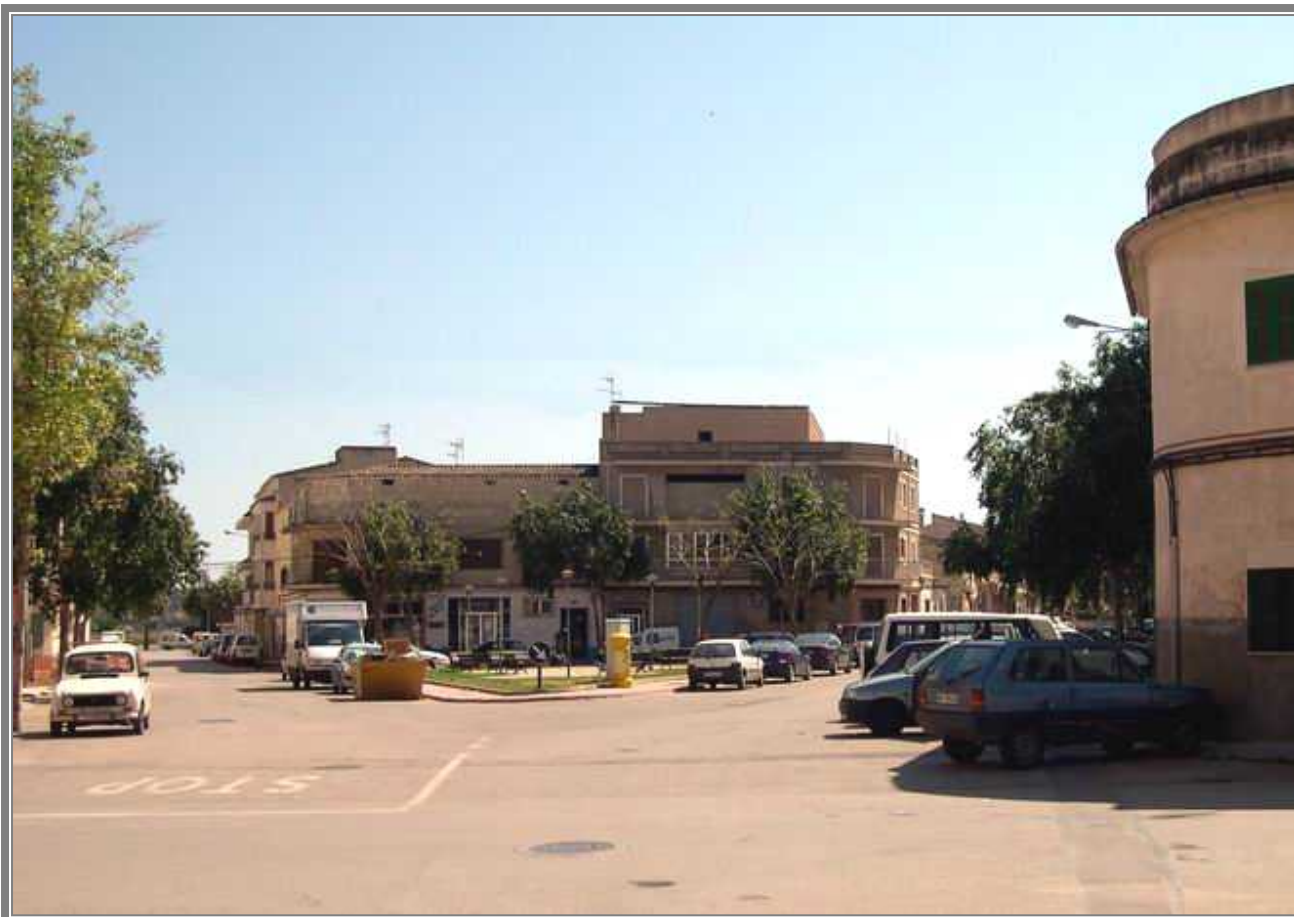
Vista de la Plaça D'en Joan March desde el final de la calle de Artá. (CCV)