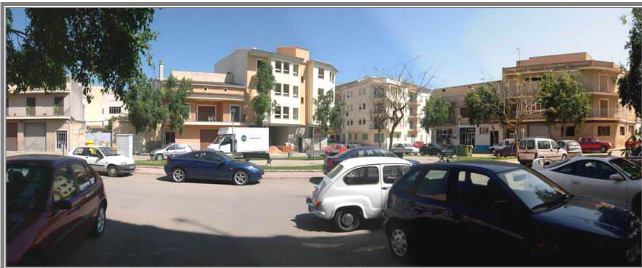
Vista panoràmica de la Plaça D'en Joan March en Manacor. (CCV)